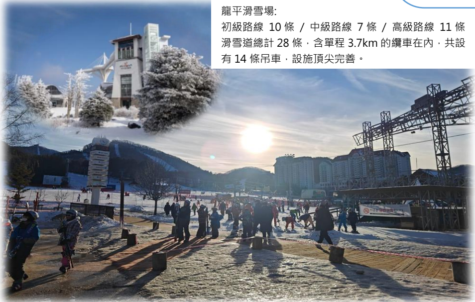
龍平滑雪場: 初級路線 10 條 / 中級路線 7 條 / 高級路線 11 條 滑雪道總計 28 條，含單程 3.7km 的纜車在內，共設有 14 條吊車，設施頂尖完善。