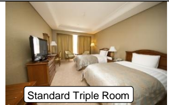
Standard Triple Room