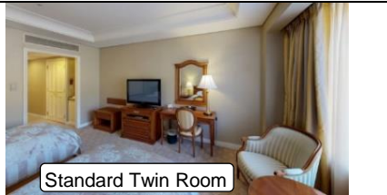
Standard Twin Room