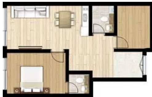
(以上圖片只供參考)

5江原樂園家庭式單位5 1 韓式房 +1 雙人房 (21 坪) 1 沖涼房+1 洗手間