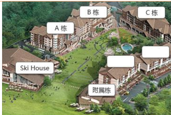
Mountain Condominium (A or B or C wing)

5江原樂園家庭式單位5 1 韓式房 +1 雙人房 (21 坪) 1 沖涼房+1 洗手間