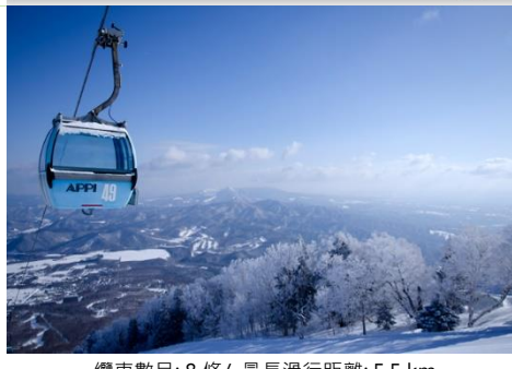
纜車數目: 8 條 / 最長滑行動距離: 5.5 km