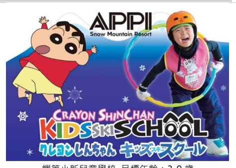
蜡笔小新兒童學校 目標年齡: 3-9 歲

Tel & : 2301-2313 Fax : 2724-5589 e-mail : kts@ktstravel.com.hk