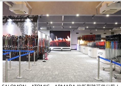
SALOMON、ATOMIC、ARMADA 的新型號可供出租!